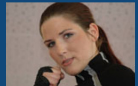
Anja Renfordt, 6-fache Weltmeisterin im Kickboxen